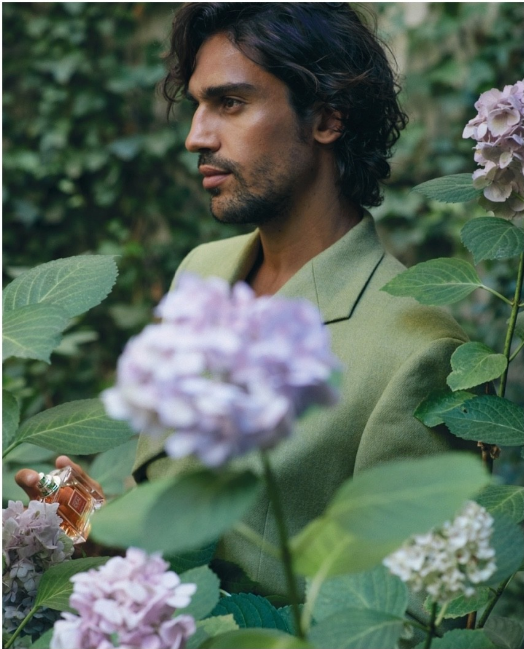
Eau de toilette intense Habit Rouge L'Instinct de Guerlain (104 €) y traje de lana verde de Duarte.