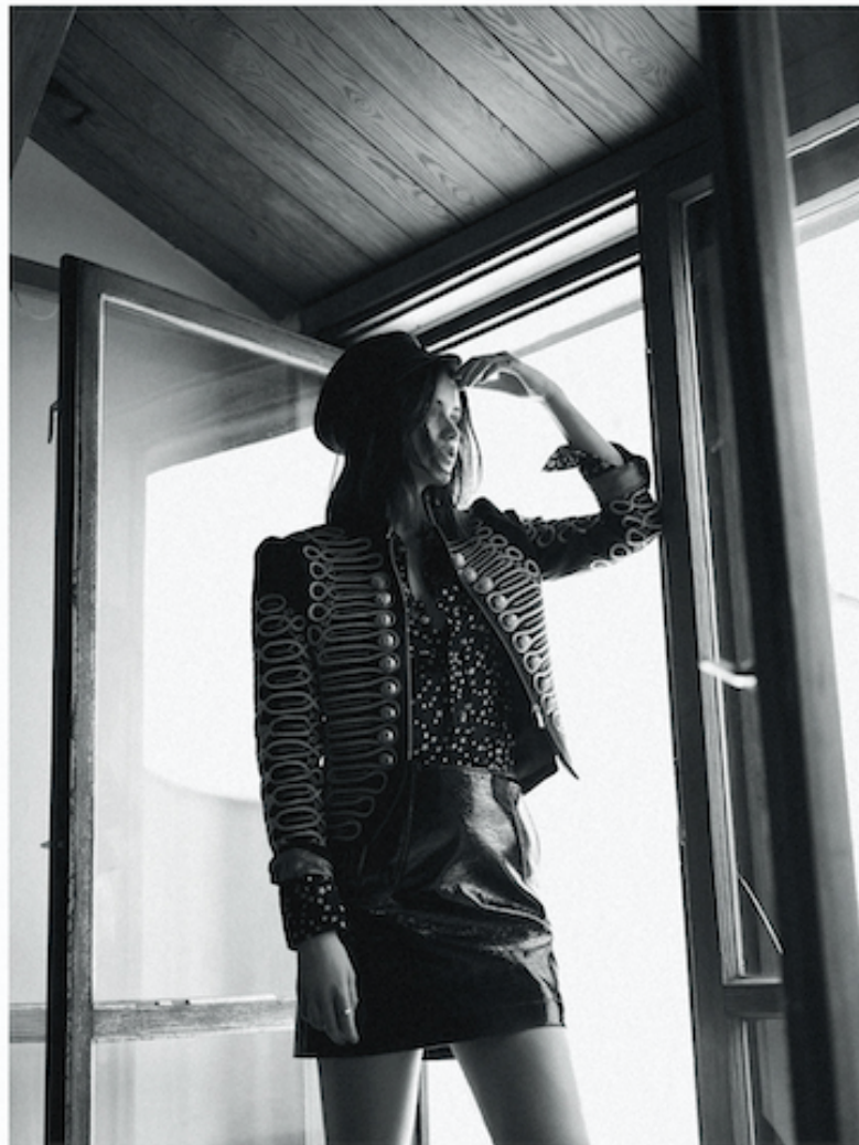
Cap vintage, Blazer by La Condesa (Lui Store), Shirt by Saint Laurent, Skirt by H&M Studio