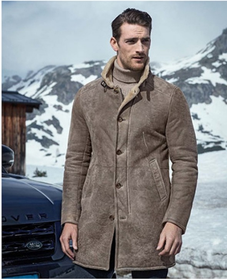
Lammfellmantel GIMOS 1.999,-